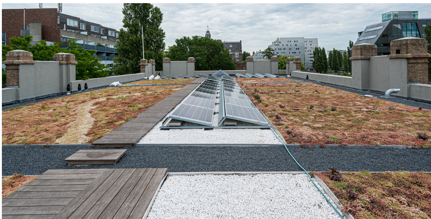
Het eerste slimme blauw-groene dak ligt op een Rijksmonument, Loydhotel, Oostelijke Handelskade 12

Voor alle gebouwen met platte daken, inclusief de monumenten, is duidelijk op welke wijze dakvergroening mogelijk is. Voor gevelgroen zijn er heldere uitvoeringsstandaarden.