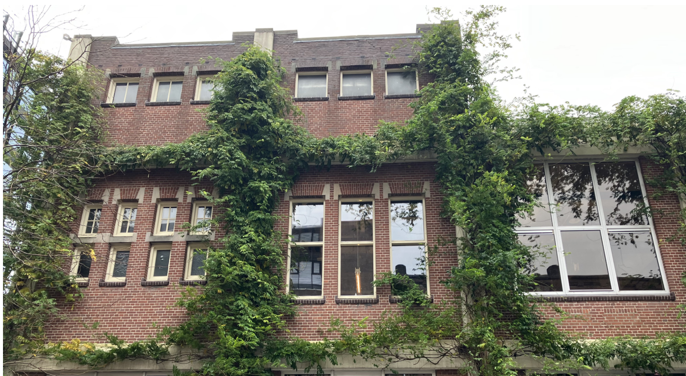
Voorbeeld gevelvergroening Voormalige Stadstimmertuin (Centrum)