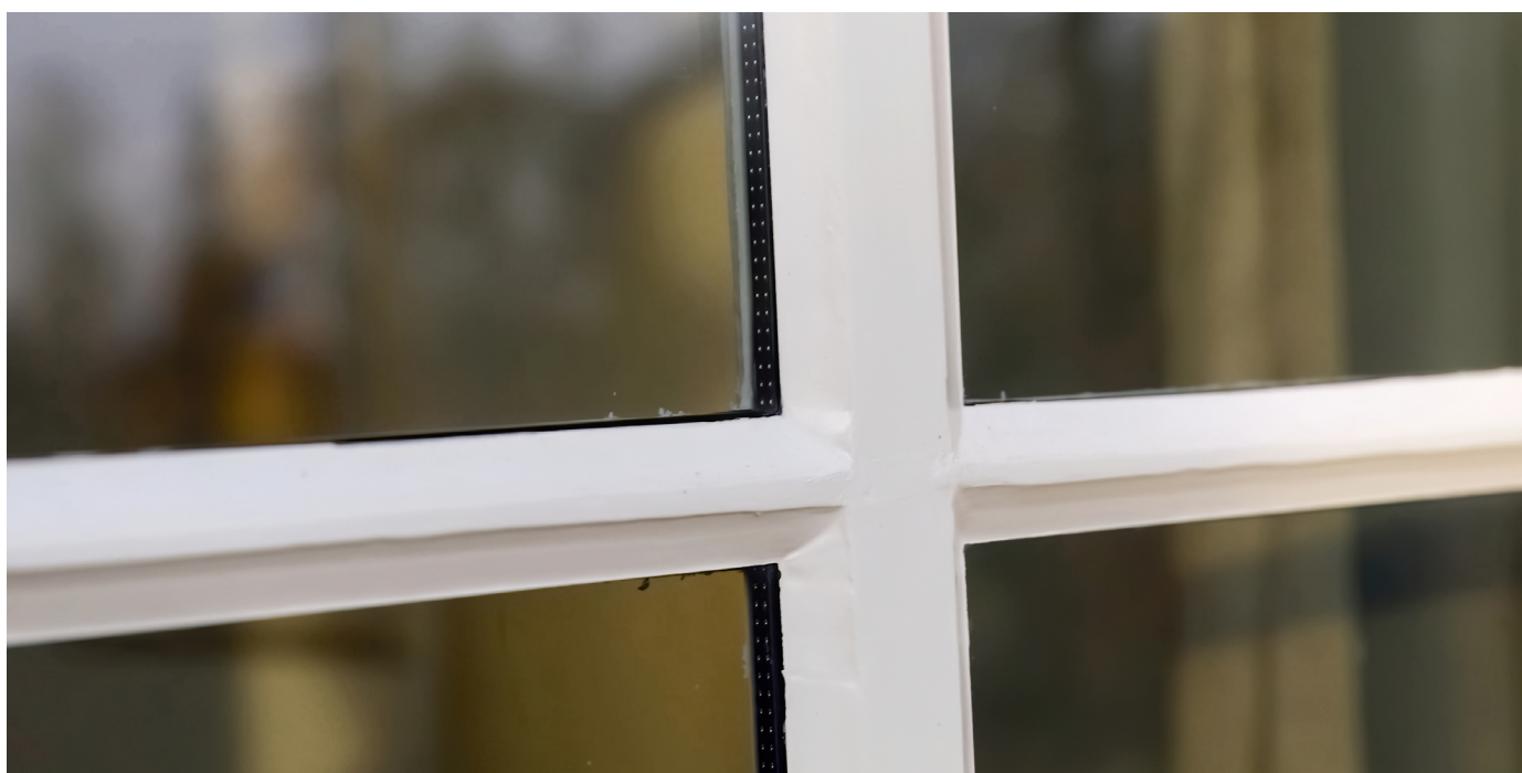
Voorbeeld van isolerend monumentenglas

Met uitvoeringsstandaarden en voorbeeldboeken is isolatie (ramen, gevel, dak) vergunningsvrij of is een vereenvoudigde vergunningsprocedure van kracht.