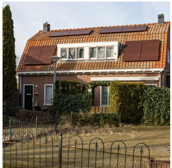
Voorbeelden van zonnepanelen in rijksbeschermd stadsgezicht in Amsterdam Noord