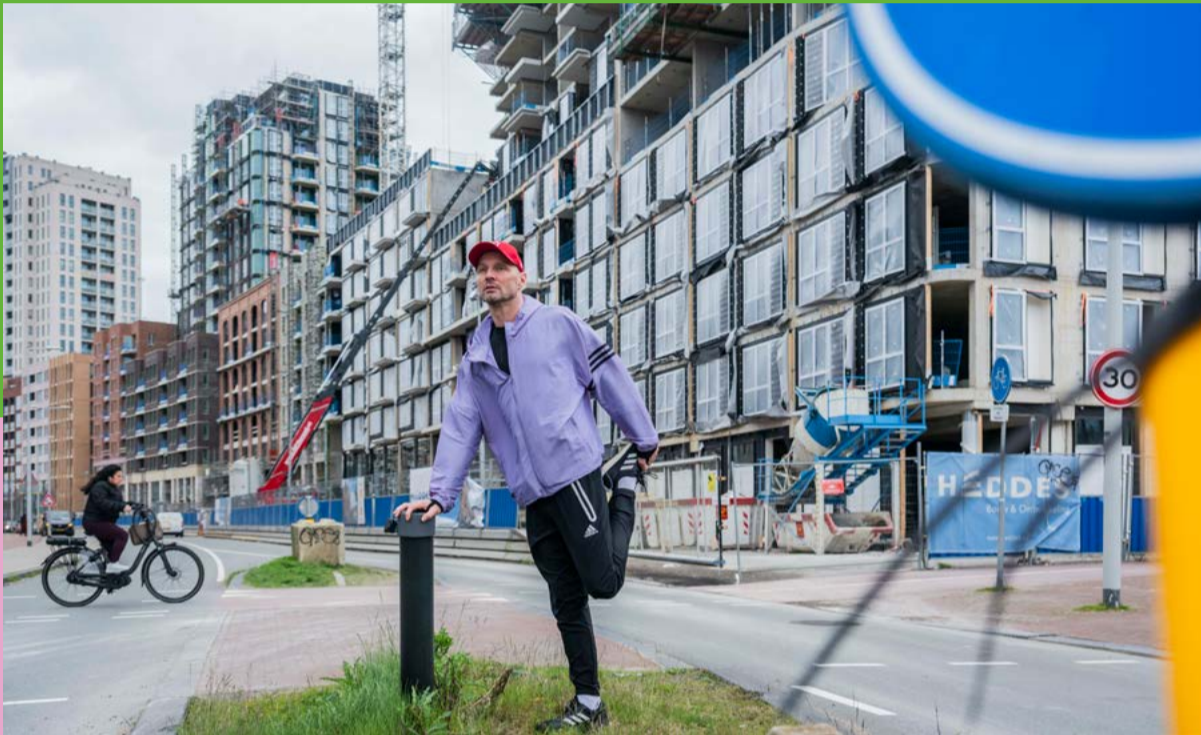
In nieuwe wijken moet grond voor groen worden gereserveerd

Amsterdam groeit. Er wonen steeds meer mensen in de stad. Die hebben huizen nodig, winkels, scholen en kantoren. Maar steen alleen is niet genoeg. In een leefbare stad is ook veel groen. Om in buiten te spelen en de hond uit te laten. Om in te sporten en tot rust te komen. Natuur is belangrijk voor de gezondheid van mens en dier. Groen houdt de stad ook droog en koel. Alle Amsterdammers hebben baat bij een groene stad. Laten we ervoor zorgen dat we die ook krijgen. Stem op 6 juni tegen de plannen van Amsterdam met ons groen.