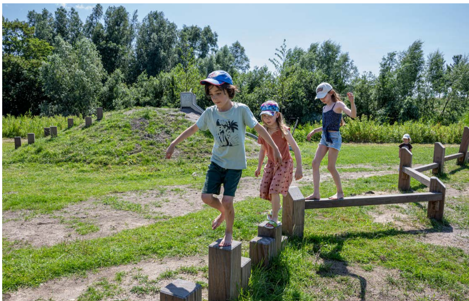
De Bretten