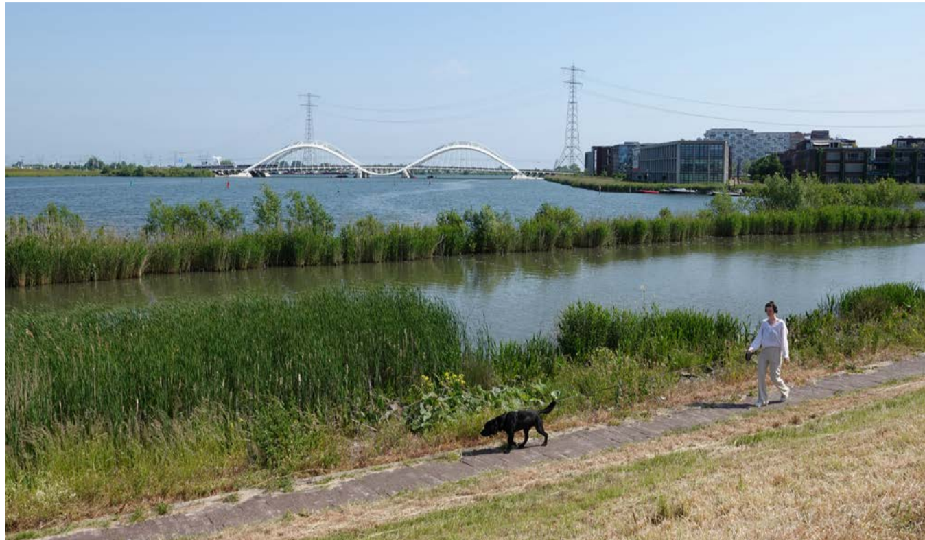
Waterkeringpad | Foto Edwin van Eis

In groengebieden zijn voorzieningen nodig. Daar houdt de Hoofdgroenstructuur rekening mee. Het groen is ingedeeld in verschillende groentypen, zoals stadspark, natuurpark en landschap. De regels over wat er wel en niet past in het groen verschillen per groentype. Zo is in stadsparken ruimte voor