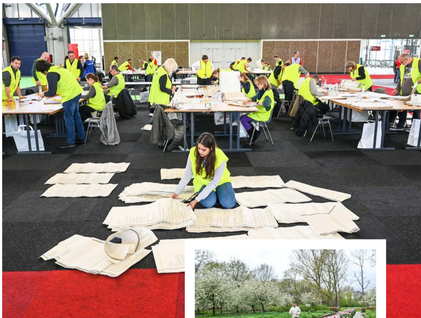
Stemmen tellen

In een openbare zitting stelt het Gemeentelijk Stembureau de definitieve uitslag vast. Dit is van 10.00 tot 11.00 uur in de raadzaal van het stadhuis, Amstel 1. Na deze zitting wordt de gemeenteraad op de hoogte gesteld van de uitslag. U kunt de zitting ook online volgen via amsterdam.raadsinformatie.nl .