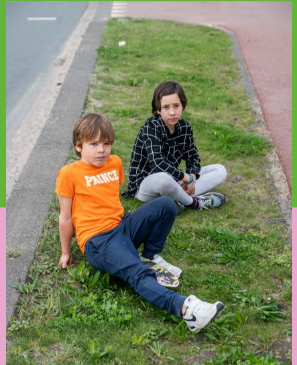
In snipper- en gevelgroen kunnen kinderen niet spelen