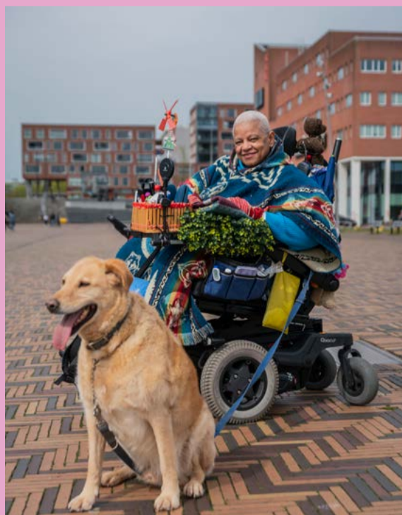
De stad versteent, er blijft steeds minder groen over

ALLE AMSTERDAMMERS HEBEN BAAT BIJ EEN GROENE STAD. LATEN WE ERVOOR ZORGEN DAT WE DIE OOK KRIJGEN.