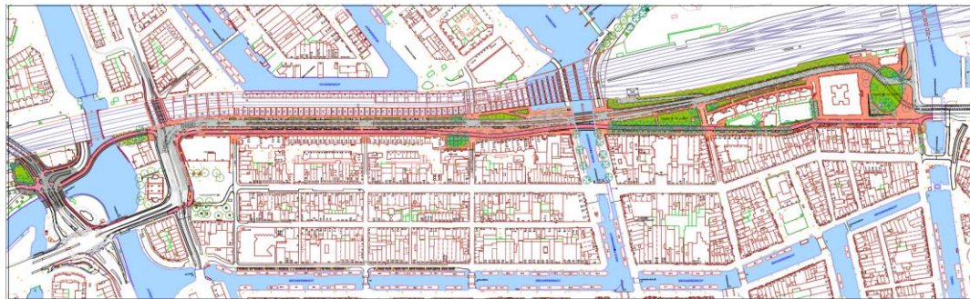
Het totale vernieuwde ontwerp

Het in de Nota van Uitgangspunten vastgesteld schetsontwerp is als studie voor het opstellen van een Programma van Eisen aangepast naar een zo genoemd vernieuwd ontwerp. Het vernieuwd ontwerp heeft een inrichting met minder asfalt, in beide richtingen is er slechts één rijbaan. De rijrichting komend vanaf Centraal Station, de oost-westrichting, is exclusief voor het openbaar vervoer en taxi's. In de west-oost richting deelt het openbaar vervoer de ruimte met het (beperkte aandeel) overig verkeer.