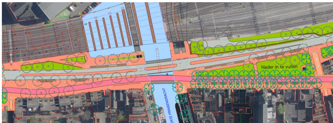
Vernieuwd ontwerp Buiten Oranjestraat – Buiten Brouwerstraat

De Plusnet openbaar vervoer corridor wordt op korte termijn niet voorzien van toegankelijke haltes op dit tracé. Mogelijk dat op een ander moment groot onderhoud of een herinrichting aan de orde is.