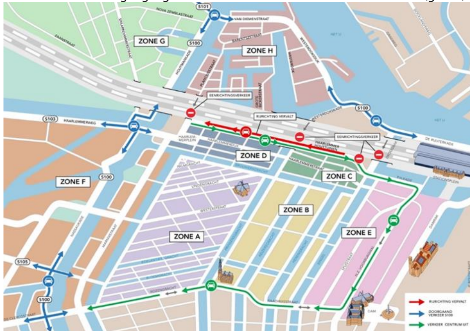
Nieuwe verkeerscirculatie na invoering van eenrichtingsverkeer op de Haarlemmer Houttuinen

Op het Droogbak wordt in de plannen de bestaande verkeersknoop ontvlecht, éénrichtingverkeer vanuit de onderdoorgang ingesteld en komt ruimte beschikbaar voor een (groen) verblijfsgebied.