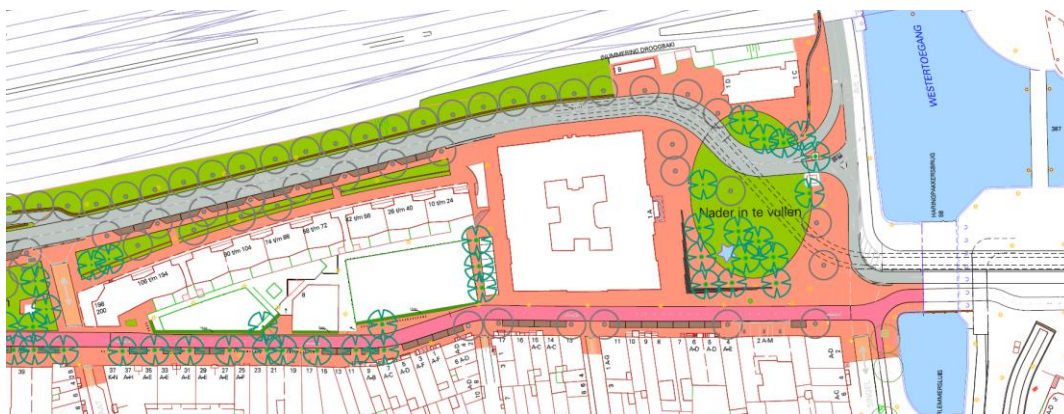
Het vernieuwde ontwerp Buiten Brouwerstraat – Singel