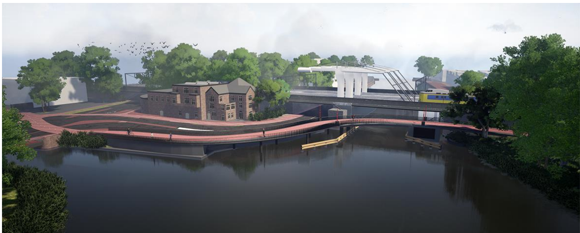
Voorkeursontwerp nieuwe fietsbrug over het Westerkanaal

Circa de helft van de fietsers op de Haarlemmerstraat en –dijk is afkomstig uit het Westerpark. En later in tijd zal meer dan de helft uit nog westelijker gelegen wijken komen als Havenstad. Deze stroom zal zich met de andere fietsers blijven samenvoegen op het overbelaste kruispunt Nassauplein en het Haarlemmerplein.