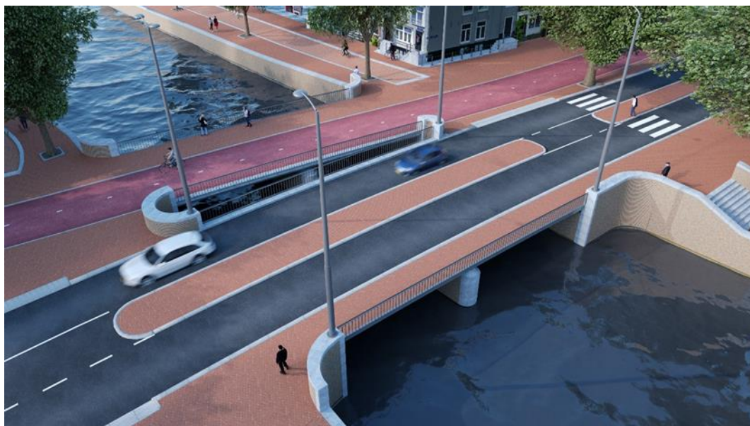
De verlaagde brug 95 over de Korte Prinsengracht