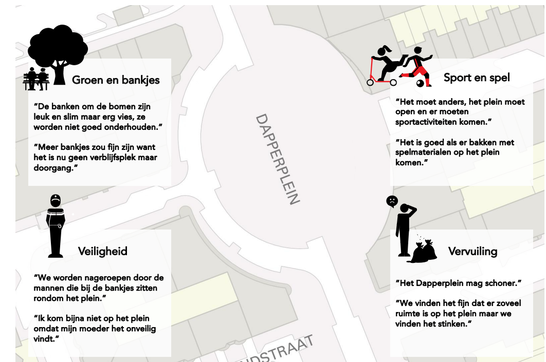
Voorbeeld van een praatplaat